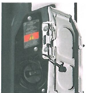
Tappo per i 75 litri del serbatoio gasolio.

cessibile attraverso un'apertura di 550 millimetri). Soffermandosi sulla postazione dell'autista, il tunnel centrale rispecchia l'inprinting della Stella, con incavo porta-oggetti, impianto stereo, in questo caso senza punto blu, a firma Actia, e minidisplay del climatizzatore Autoclima Rt 145, forte di una potenza frigorifera di 14,5 chilowatt.