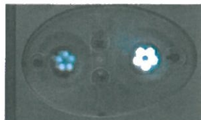
Spot accesi sulla semiellissi