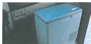
Frigo Indel da 20 litri. Potrà venire incassato.