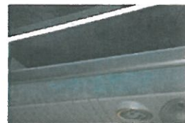
Cappelliere rifinite in vellutino capaci di 0,39 m 3 .