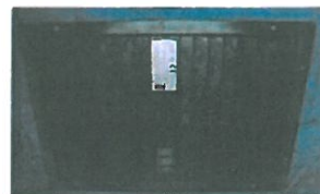
Griglia di riciclo dell'aria di Pastore & Lombardi.